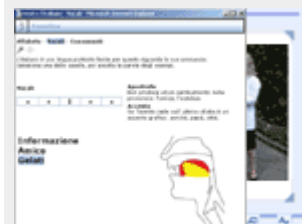
Un esempio tratto dalla Fonetica

Web-CD: • Javascript abilitati • Acrobat Reader (vers. 5 o sup.) • Lettore Cd-rom 8x