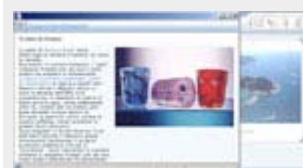
Un esempio di Approfondimento