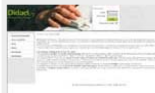
L'ambiente di e-Learning Dentro l'Italiano WLE